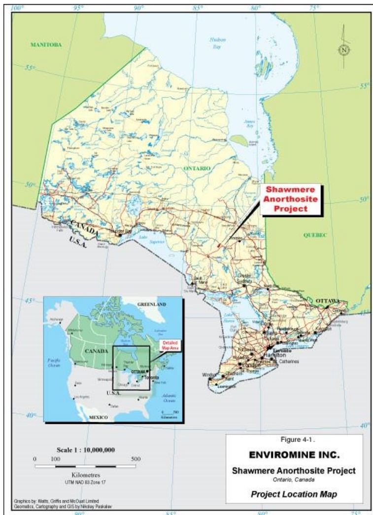
Figure 1 : Emplacement du projet

Le gisement minier d'Enviromine à Shawmere est situé dans les limites de la zone nord-est du Complexe d'anorthosite de Shawmere. Le centre de cette zone du complexe est situé à 48° 15' de latitude N et à 82° 35' de longitude O, et la zone s'étend sur environ 300 km 2 . La zone est située à environ 100 km à l'ouest de Timmins et 90 km au nord-est de Chapleau, dans la région minière de Porcupine en Ontario. Elle comprend le canton de Carty, la partie sud-est du canton de Lemoine, ainsi que de petites portions des cantons d'Oates, de Foley et d'Ivanhoe. La cartographie de la zone se trouve sur les cartes aéromagnétiques 2247G et 2248G, les cartes OGS préliminaires P2383 et P2384 (Riccio, 1981). Les cartes quadrillées SNRC n os 42B02W, 42B07W et 42B08W couvrent également certaines portions du Complexe d'anorthosite de Shawmere. Les claims sont détenus par Enviromine et sont situés dans les limites de la carte SNRC 42B02W.