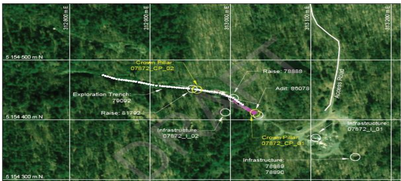
Figure 2 – Emplacement des dangers miniers sur la propriété de la mine de cuivre Gould. Les limites de la zone visée par le projet sont définies par le chemin d'accès à la mine et la zone entourant les dangers miniers.

Les autres dangers miniers qui seront abordés dans le cadre des travaux de réhabilitation comprennent les deux monteries vers la surface et les restes de diverses infrastructures minières. L'emplacement de tous les dangers miniers sur la propriété est illustré ci-dessous dans la Figure 2. La stratégie de réhabilitation privilégiée pour les deux monteries consiste à remblayer celles-ci en utilisant une combinaison de matériaux cimentés et non cimentés pour en maintenir la stabilité à long terme. L'infrastructure minière qui sera déclassée dans le cadre des travaux de réhabilitation comprend une sous-station hydroélectrique, les fondations du site de l'usine, un réservoir d'eau et deux barils en acier. Les zones perturbées seront remblayées et paysagées, au besoin, et pourront ainsi se revégétaliser naturellement pour s'harmoniser avec l'habitat environnant.